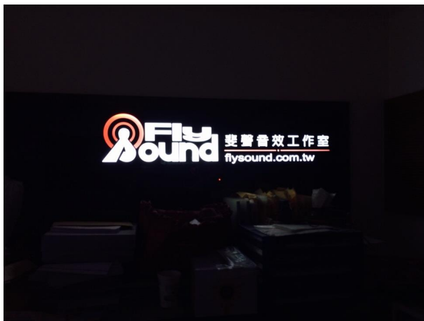
斐聲音效工作室 LOGO 以簡單的黑白紅三色構成的招牌。