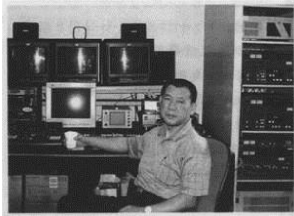
圖 1：早期剪接室租用一小時要 2 千元。