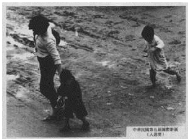
圖 2：攝影得獎作品 — 七股鹽田風光。