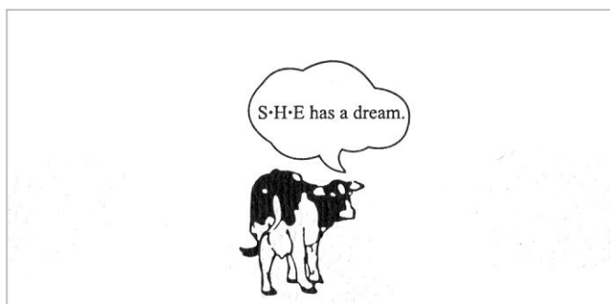
(名片封面，以女性特質鮮明的乳牛為工作室象徵)

離開廣告公司，她到了美國加州 UCLA 進修，學了她夢寐以求的電影製作。回國後，因緣際會之下藉著一位銀行家長輩的資助，邀集幾位以前的女同事成立了以做公益廣告為主的大好工作室。至今，以「S.H.E. has a dream...」為名的大好工作室已過了二十個年頭，他們不單單只是作著夢，而是把夢想實現，帶給大家許許多多精彩的公益廣告、節目及紀錄片。