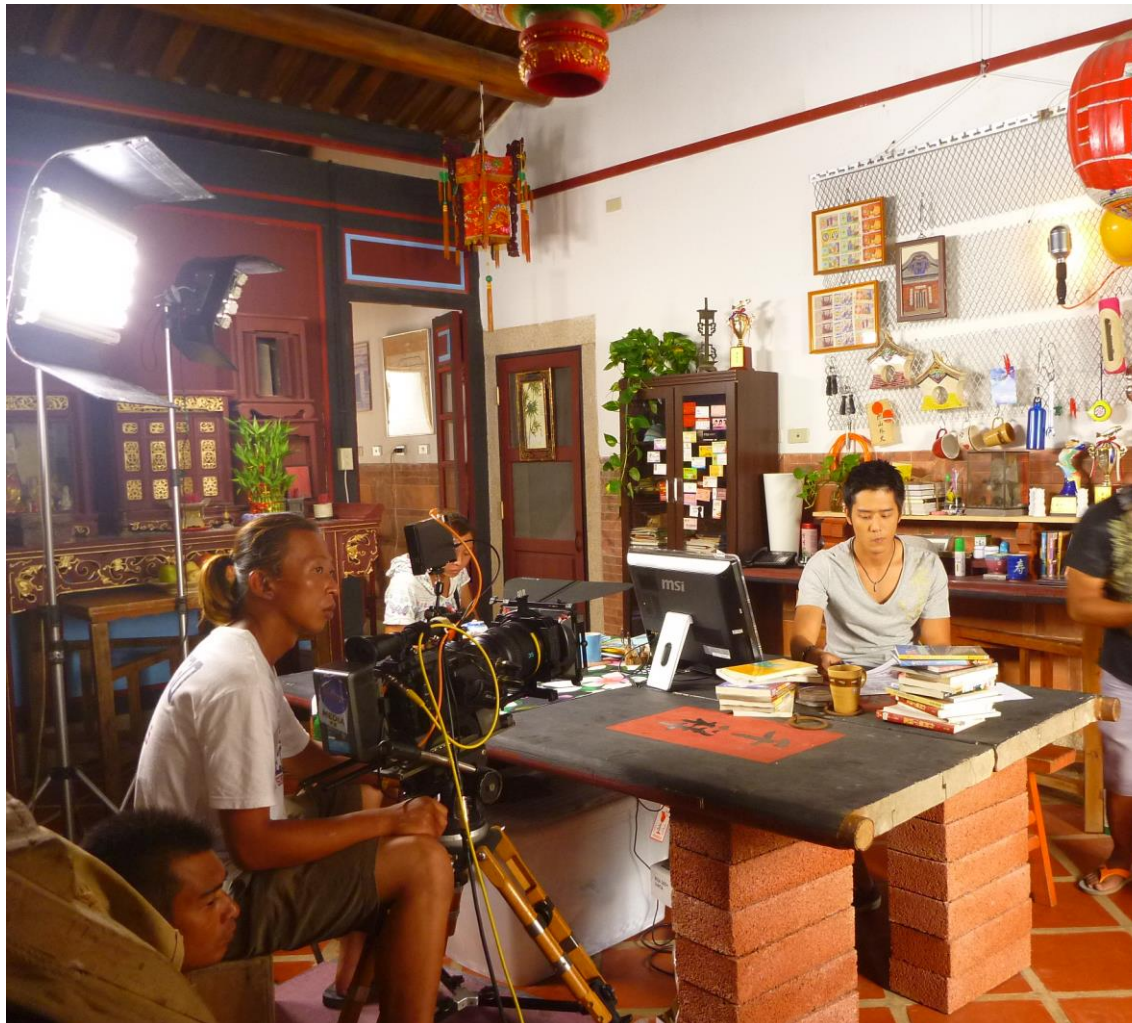
圖 2：《戀夏 38 度 C》阿寬的家現場佈景

其實，她的美術設計也不是只有場景而已，還擴大到了劇中人物角色服裝造型設計的搭配上，這似乎也成為目前大陸劇的趨勢，「因為要和那場景、劇情配合」，這在台灣也不太一樣，也就有很多和演員合作的經驗，鄭靄雲提起她覺得印象很深的是一個演員梁又琳（按：電影《我是中國人》），是一個配合度很高的女星，完全沒架子，什麼造形、衣服在她身上就是適合、就是美，因為她是一個有自信的女人，彷彿穿什麼都無所謂，可是她在投足之間就把那感覺穿出來了，令她印象深刻，「當然」，她強調，「我們也不會故意找不適合的(服裝)給演員穿，我們比演員更重視美感。」