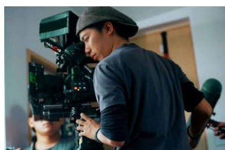
P.06-1 圖說:攝影獎 趙冠衡/公視人生劇展-衣櫃裡的貓(摘至 timely.tv 電視精靈)

趙冠衡是今年金鐘獎得主、曾憲忠是資深老手、陳國隆是攝影高手、陳文田則是電視台內攝影師、韓紀軒是一把青攝影師、陳宗志入圍今年金鐘獎、李鳴也是入圍金鐘獎常客、陳文欽大部份攝影大愛劇場。