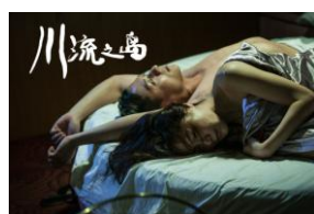
P.15-1 圖說: 迷你劇集／電視電影導演獎、編劇獎

韓劇、陸劇是時下許多人茶餘飯後討論的話題，其年齡範圍不僅止於年輕人，甚至廣泛至中老年人都瘋狂的追劇、追星。其實最主要的是背後有一筆龐大的資金可供運作，無論是演員們的外表打扮、拍攝場景、道具等，都需要一定的費用才能拍出一定的水準，進而提供演員們一個展現自我的舞台，當然，前提還是需要有一個引人入勝的劇本。攸關節目品質及從業人員的生活，中國大陸電視節目提供的製作費非常優渥，用人的報酬常是臺灣的 3、4 倍，所以吸引不少臺灣人員及幕後工作者前往發展。反觀臺灣目前的電視圈生態，似乎陷入了低靡之中，雖有好人才、好劇本，但經費不足，也做不出好節目，人才外流日益嚴重。加上網路電視直播節目的崛起，電視生態已改變，各電視台如何求生，面臨巨大挑戰，否則就面臨淘汰危機。如何在有限的資源裡，留住人才並帶來更多的經費，不僅是電視人，也是觀眾們值得深討的課題。