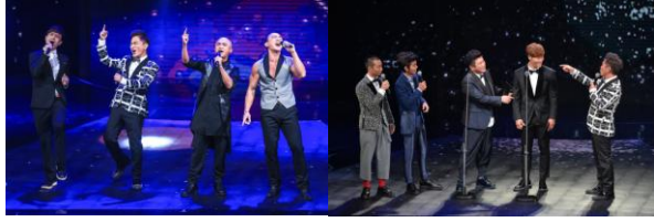
P.15-3~4 圖說:金鐘 51 精彩片段(摘自 timely.tv 電視精靈)