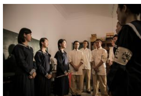
P.04-1 圖說:戲劇節目編劇獎「燦爛時光」劇照

編劇是一部戲的靈魂，一部好戲一定要有好的故事，才能吸引觀眾，鄭文堂的燦爛時光描述白色恐怖的故事，拍攝辛苦。同樣的，「一把青」是抗戰的故事，也拍得十分辛苦。簡奇峯的必娶女人也為柯佳嬿奪得金鐘獎最佳女主角，寫實劇的川流之島的詹京霖也得金鐘獎編劇，各種戲劇都很精彩。